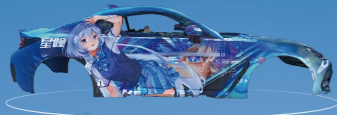
Données de numérisation